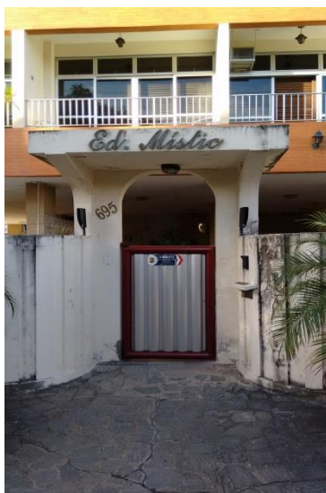
Foto 30 - Entrada do Edifício MÍSTIC