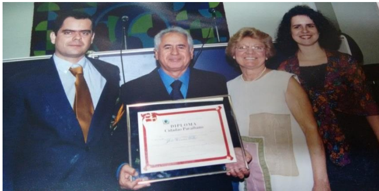
Foto 33 - Casal recebendo o Título de Cidadão Paraibano