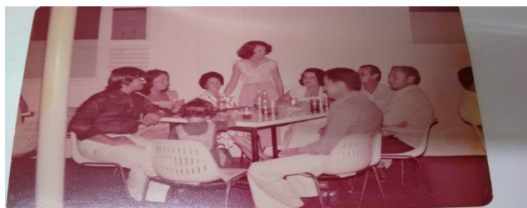
Foto 24 - Lazer para adultos