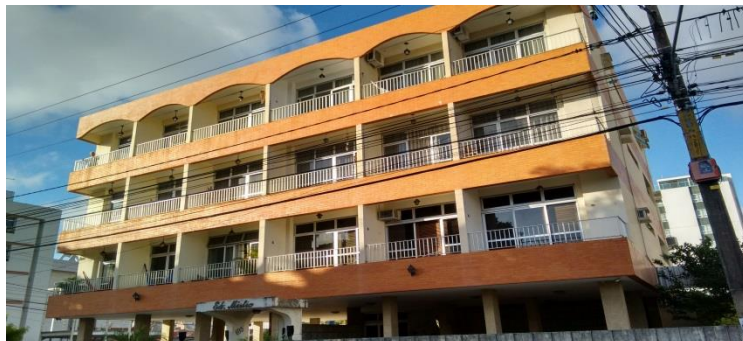
Foto 29 - Fachada Leste do Edifício MÍSTIC

Nesta Cidade de João Pessoa (PB), procuramos fincar nossas raízes e, após um planejamento minucioso, com mais cinco companheiros, construímos o EDIFÍCIO MÍSTIC: