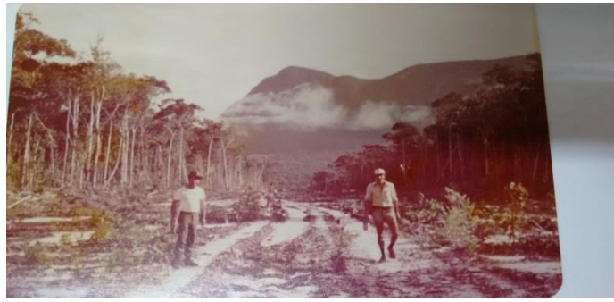
Foto 21 - Visita à BR-307, Frente Sul e Serra do Padre