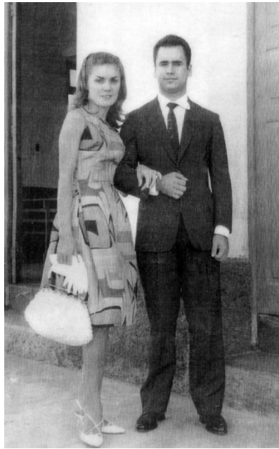
Foto 13 - Já noivos, em 1964