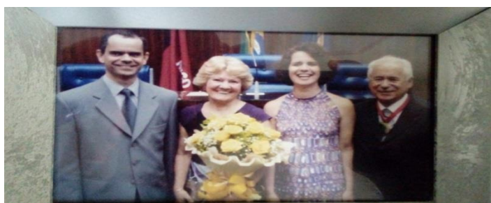
Foto 36 - O casal, comemorando com os filhos, o recebimento da Comenda Verde