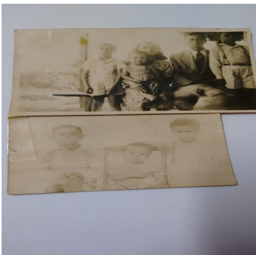
Foto 1 - Sítio Coruripe da Cal, Distrito de Palmeira dos Índios (AL)