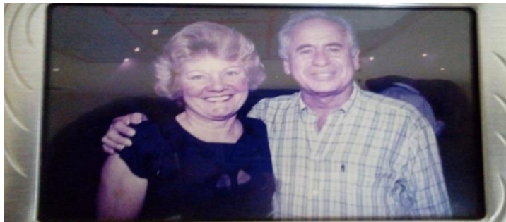
Foto 32 - Casal em momento de descontração

Logo que passei para a Reserva Remunerada, fui trabalhar como Diretor Regional na Construtora Estrela, durante 06 (seis) anos. Trabalhei em empresas do ramo imobiliário, na Assembleia Legislativa e no Governo do Estado, aposentando-me pelo INSS. Em 1985, passei a me dedicar a um problema do futuro: “A ÁGUA NO 3º MILÊNIO” e proferir palestras, nos quartéis, em Brasília, no Ministério da Defesa, inclusive para o CPEAEX, para os Coronéis-Alunos e em quase todos os municípios da Paraíba, o que me permitiram ser contemplado com: Comenda Verde, Ordem do Mérito Militar, Ordem do Mérito da Defesa, Título de Cidadão Paraibano, Título de Cidadão Pessoense, Medalha do Pacificador e recebendo muitas Condecorações e Títulos: