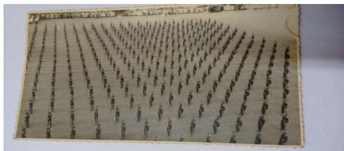
Foto 8 - Formatura da entrega do Espadim aos 432 Cadetes

Saindo Aspirante em 20 de Dezembro de 1962, da Turma AMAN 62, batizada de Turma Duque de CAXIAS, com um grande efetivo de 432 Aspirantes, dos quais 07 (sete) chegaram a General-de-Exército, os 4 Estrelas, e 46 escolheram a Arma de Engenharia .