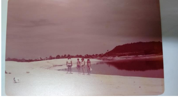
Foto 25 - Lazer na Praia do Rio Negro, para a família