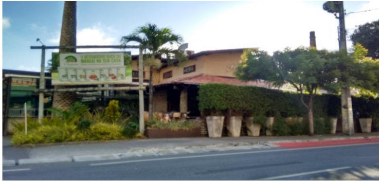
Foto 31 - Restaurante MANGAI - o primeiro

Logo que passei para a Reserva Remunerada, fui trabalhar como Diretor Regional na Construtora Estrela, durante 06 (seis) anos. Trabalhei em empresas do ramo imobiliário, na Assembleia Legislativa e no Governo do Estado, aposentando-me pelo INSS. Em 1985, passei a me dedicar a um problema do futuro: “A ÁGUA NO 3º MILÊNIO” e proferir palestras, nos quartéis, em Brasília, no Ministério da Defesa, inclusive para o CPEAEX, para os Coronéis-Alunos e em quase todos os municípios da Paraíba, o que me permitiram ser contemplado com: Comenda Verde, Ordem do Mérito Militar, Ordem do Mérito da Defesa, Título de Cidadão Paraibano, Título de Cidadão Pessoense, Medalha do Pacificador e recebendo muitas Condecorações e Títulos: