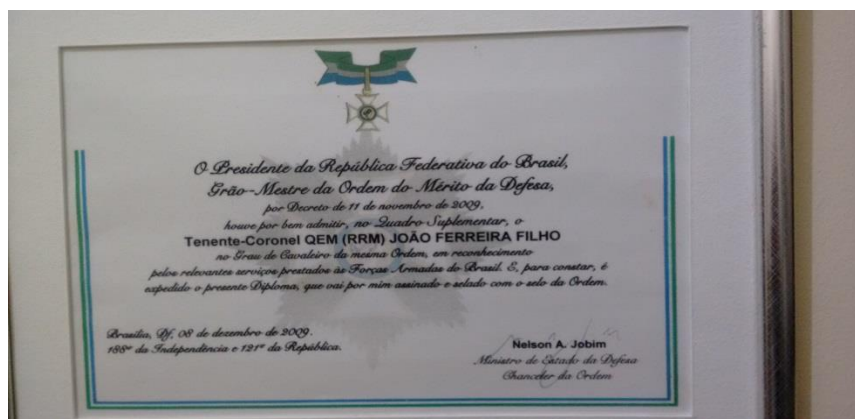
Foto 40 - Ordem do Mérito da Defesa no Grau de Cavaleiro