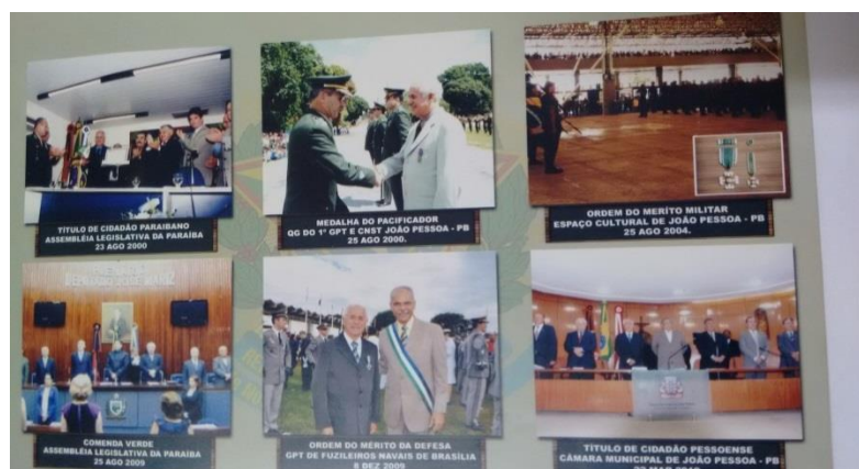
F 42 - Quadro do Recebimento das Condecorações

Tudo que fizemos foi espelhado no pensamento do filósofo irlandês Edmundo Burke, do século XVIII: “ninguém comete maior erro do que não fazer nada porque só pode fazer pouco”.