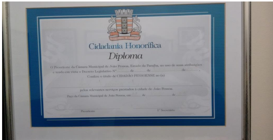
Foto 34 - Título de Cidadão Pessoaense