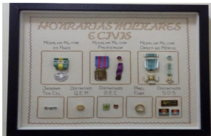
Foto 41 - Quadro de Insígnias