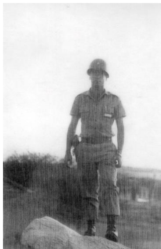
Foto 11 - Aspirante, namorei e dancei muito