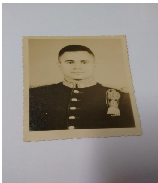
Foto 6 - Cadete da AMAN

Na Escola Preparatória de Cadetes de Fortaleza, no 3º Ano, consegui a pontuação exigida para ingressar na AMAN.