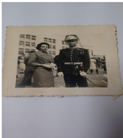
Foto 7 - Madrinha na entrega do Espadim

Saindo Aspirante em 20 de Dezembro de 1962, da Turma AMAN 62, batizada de Turma Duque de CAXIAS, com um grande efetivo de 432 Aspirantes, dos quais 07 (sete) chegaram a General-de-Exército, os 4 Estrelas, e 46 escolheram a Arma de Engenharia .